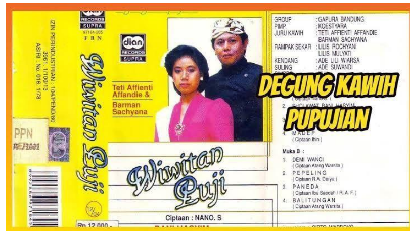
Gambar 3.1 Cover Album CD Wiwitan Puji