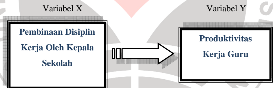
Gambar 1. 1

Hipotesis penelitian dapat digambarkan sebagai berikut :