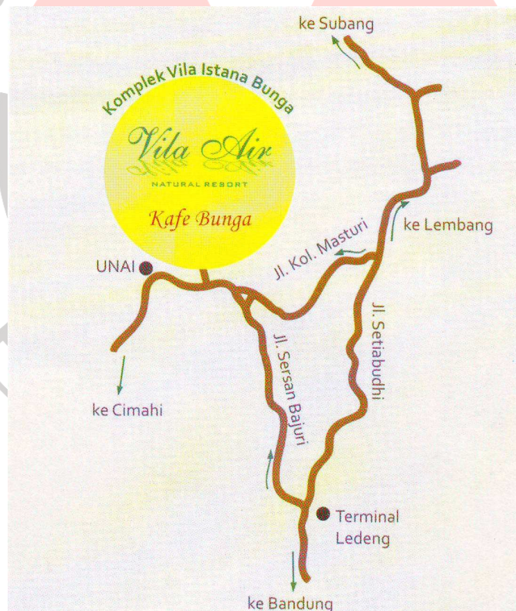
Gambar 3.1 Denah Lokasi

Pencarian data & informasi untuk penulisan dilakukan di Villa Air Natural Resort yang berada di J.I Kolonel Masturi K.M 9 komp Istana Bunga Lembang – Bandung , Jawa Barat.