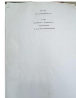
Gambar 3.2 Naskah drama “Nu Jaradi Korban