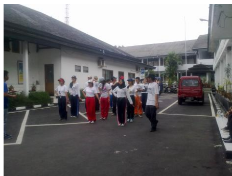
Gambar 3.2 Tempat Latihan Marching Band (Sumber Dokumentasi Peneliti tahun 2012)

Latihan dilaksanakan di area parkir dan halaman gedung kantor Pemerintah Daerah Kota Sukabumi.