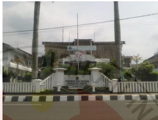
Gambar 3.1 Gedung Kantor Pemerintah daerah Kota Sukabumi

Kantor Pemerintah daerah Kota Sukabumi di jalan R.Syamsudin,SH. No. 25 merupakan tempat latihan Marching Band Gema Suara Korpri Kota Sukabumi. Selain itu, Kantor Pemerintah daerah Kota Sukabumi letaknya cukup strategis sehingga mudah di jangkau untuk melakukan penelitian.