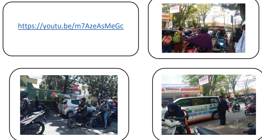
Gambar 3. 1 Materi Bahasa Indonesia

Video dan Foto Kemacean Lalu lintas di SDN 263 Rancaloea