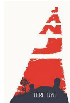
Gambar 3. 1 Kover Novel