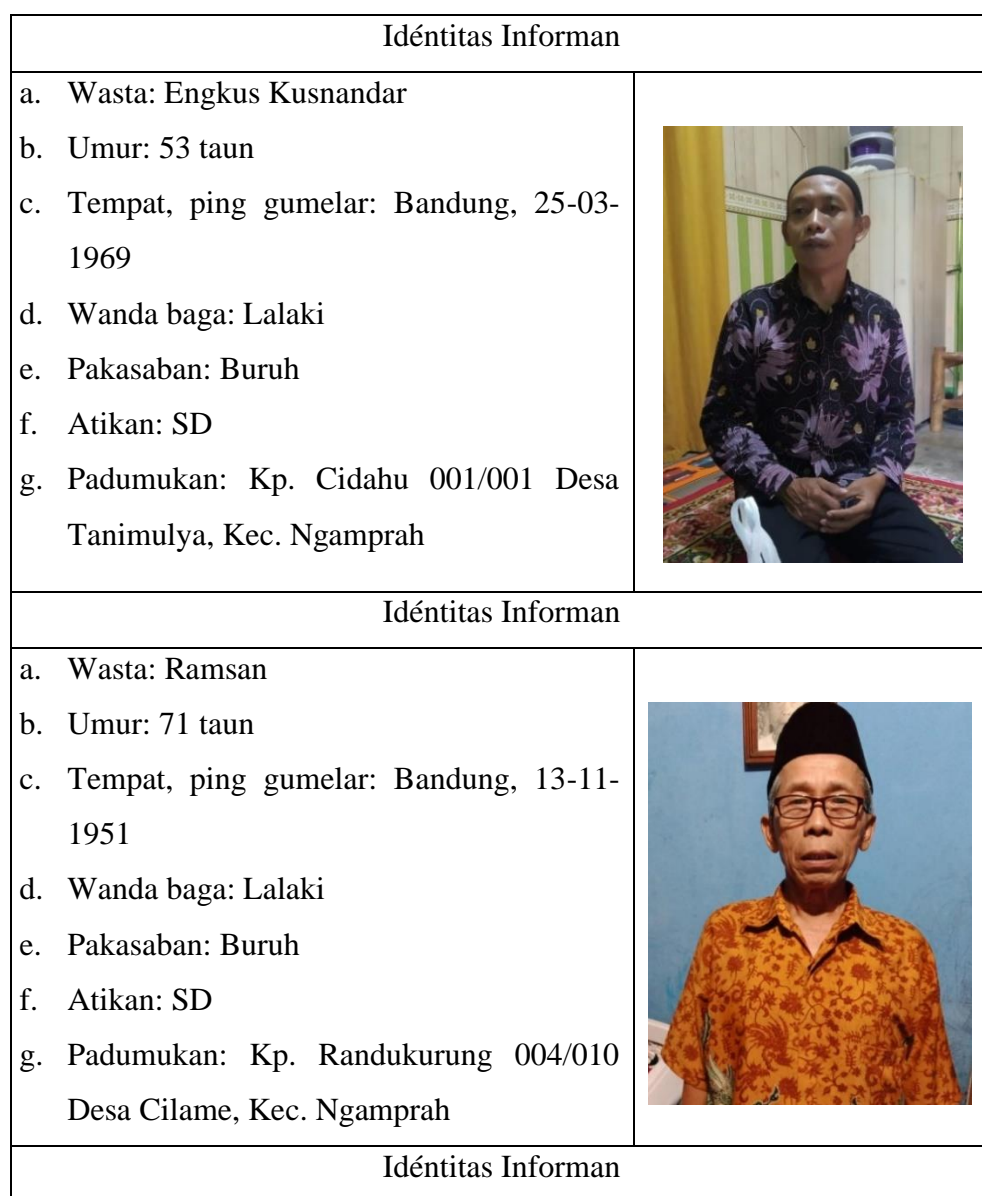
Tabél 3.1 Daptar Biodata Informan

Informan dina ieu panalungtikan nya éta masarakat Kacamatan Ngamprah jeung sabudeureunana anu apal kana dongéng-dongéng nu aya di Kacamatan Ngamprah. Aya sababaraha informan anu diwawancara pikeun meunangkeun data, nya éta, (1) Bapa Sony, (2) Bapa Ramsan, (3) Bapa Engkus, (4) Bapa Entur, jeung (5) Bapa Aa Sasmita.