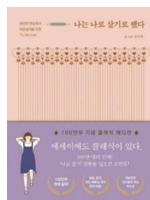
Gambar 3. 1 Sampul Buku ‘I Decided To Live As Me’ karya Kim Su Hyeon

Sugiyono (2013, hal. 224) menjelaskan bahwa pada proses pengumpulan data, data diperoleh dalam berbagai setting , berbagai sumber, dan berbagai cara. Sumber data dapat berupa sumber primer, yaitu sumber yang langsung memberikan data yang diteliti dan sumber sekunder yang tidak langsung memberikan data kepada pengumpul data. Sumber data dari penelitian ini adalah buku kumpulan “나는 나로 살기로 했다 (I Decided to Live as Me)’” karya Kim Su Hyeon.