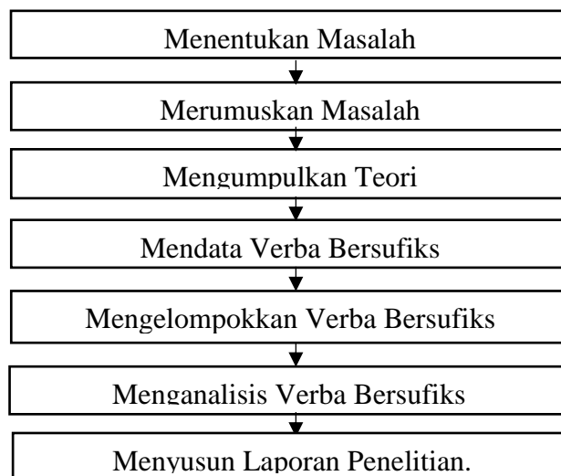
Bagan 3. 1 Desain Penelitian

Desain penelitian adalah rancangan atau gambaran mengenai tahapan-tahapan penelitian yang dilakukan. Desain penelitian yang digunakan dalam penelitian ini adalah pendekatan kualitatif. Sugiyono (2013, hal. 9) mengemukakan bahwa penelitian kualitatif merupakan penelitian yang digunakan untuk meneliti kondisi objek yang alamiah. Pada penelitian kualitatif, peneliti berperan sebagai instrumen kunci dan teknik pengumpulan data dilakukan dengan cara triangulasi atau gabungan. Analisis data pada pendekatan kualitatif bersifat induktif atau kualitatif, dan hasil penelitiannya lebih menekankan makna dibandingkan generalisasi. Namun, metode penelitian yang digunakan untuk penelitian ini adalah metode deskripsi, yang memiliki tujuan untuk menggambarkan sufiks pembentuk verba bahasa Korea pada buku kumpulan “나는 나로 살기로 했다 (I Decided to Live as Me)” karya Kim Su Hyeon. Desain penelitian tersebut digambarkan dengan bagan sederhana sebagai berikut.