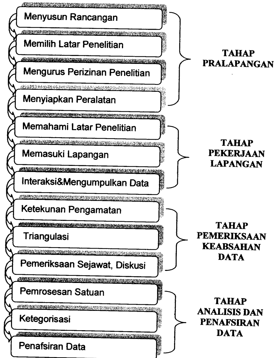
Bagan 3.3 Rangkaian Tahap-Tahap Penelitian

Tahap tahap penelitian yang dilakukan dalam penelitian ini dapat digambarkan melalui bagan berikut ini.