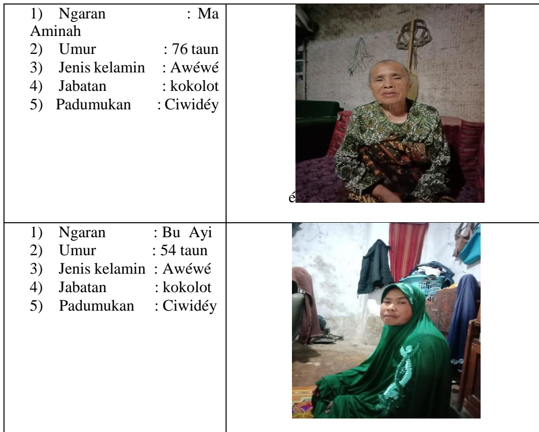
Tabél 3.1 Data Narasumber

Sumber data dina ieu panalungtikan nya éta para sesepuh masarakat, kulawarga anu apal kana kajadian dongéng-dongéng, jeung masarakat asli daérah Ciwidéy jeung Rancabali. Aya sababaraha tokoh masarakat anu diwawancara pikeun meunangkeun data nyaéta, (1) Abah Isak, (2) Abah Épri, (3) Abah Abéd, (4) Ibu Ayi, (5) Ibu aminah (6) Bapa Ujang.