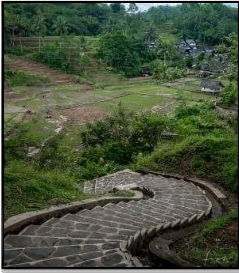
Gambar 3. 2 Tangga Kampung Naga

Ieu tangga mangrupa jalan hiji-hijina pikeun ngajugjug ka Kampung Naga nu réana aya 439 anak tangga, nyambungkeun ti lokasi parkir nepi ka Kampung Naga.