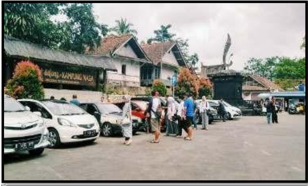
Gambar 3. 3 Lokasi Parkir

Ieu foto mangrupa parkiran ogé lawang pikeun tamu atawa wisatawan nu rék ka Kampung Naga. Di ieu parkiran nyampak sababaraha kios nu ngajual aksésoris kerajinan, kadaharan, jeung koprasi.