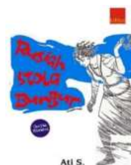
Gambar 3.1 Sampul Novél

Judul : Rusiah Stola Bungur Pangarang : Ati S. Pamedal : PT Kiblat Buku Utama Taun Medal : 2021 Jumlah Kaca : 112 Kaca