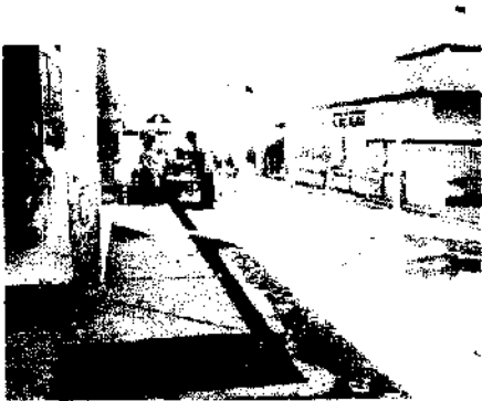
Gbr. 15 jalan dijadikan transaksi berjualan Jalan dijadikan tempat menjemur