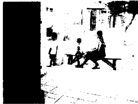
Gbr. 16 ibu duduk sambil menyuapi anaknya