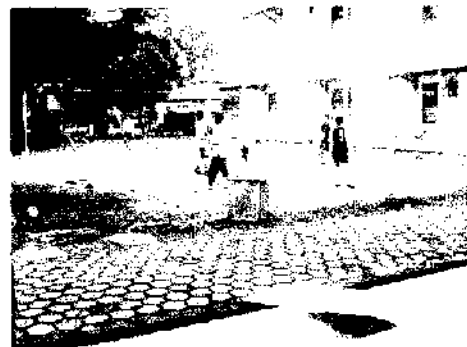
Gbr. 18 penghuni berolahraga di lapang olahraga