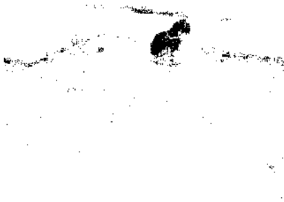
Gbr. 13 anak bermain tanah di pinggir jalan