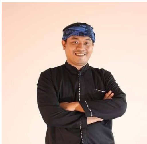
Gambar 3. 2