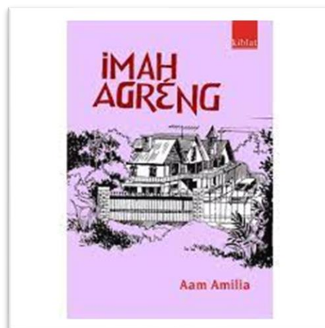
Gambar 3.1 Jilid Novel Imah Agréng

Pangarang : Aam Amilia Jumlah kaca : 71 kaca Taun terbit : 2021 Penerbit : Buku Kiblat Utama