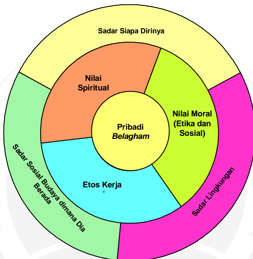
Gambar: 6.5. Konfigurasi Pribadi Belagham