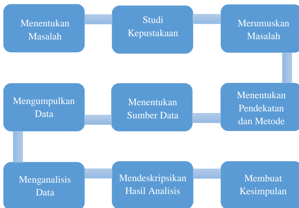
Gambar 3.1 Bagan Alur Desain Penelitian

Dari pemaparan tersebut, dapat disimpulkan bahwa penelitian ini menggunakan pendekatan kualitatif dengan metode analisis konten dan hasil penelitian akan disajikan dalam bentuk deskripsi. Penelitian ini menguraikan hasil analisis dengan mendeskripsikan seperti apa muatan literasi emosi yang terdapat dalam buku tematik kelas IV SD. Oleh karena itu, alur penelitian yang dilakukan oleh peneliti sebagai berikut.