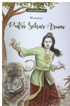
Gambar 3.1 Wawacan Putri Sekar Arum