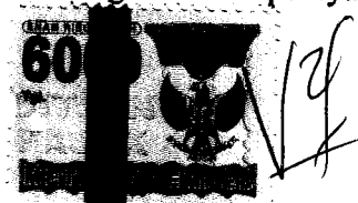
Pipit Puspita R 010365

Bandung, Agustus 2007 Yang membuat pernyataan