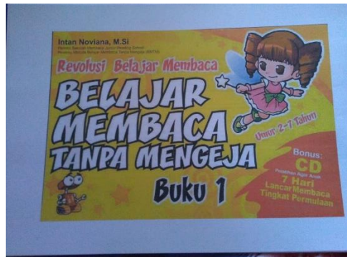
Gambar 3. 1: Instrumen Membaca Permulaan