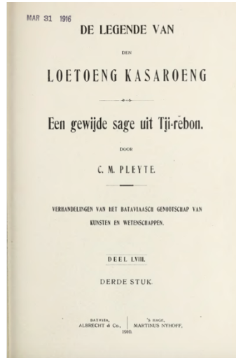
Gambar 3 2 Jilid Carita Pantun Lutung Kasarung (C.M Pleyte)