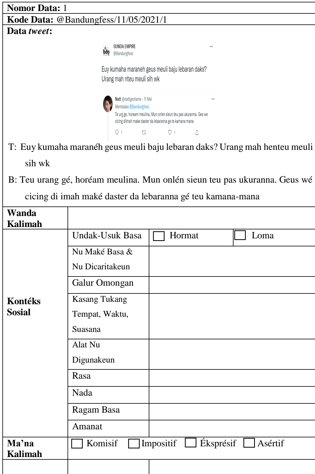
Tabél 3.1 Kartu Data