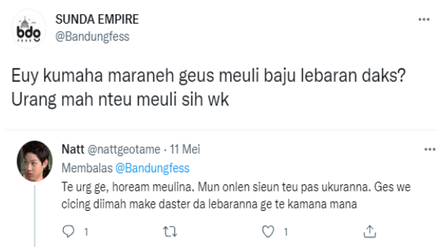
Gambar 3. 1 Data jeung sumber data

Pikeun ngumpulkeun data diperlukeun sumber data. Nurutkeun Arikunto (2013, kc. 172), sumber data dina panalungtikan nyaéta subjek anu bisa dipaké pikeun meunangkeun data. Anu jadi sumber data dina ieu panalungtikan nyaéta kalimah-kalimah basa Sunda dina twitter tina sababaraha akun base (kelompok) urang Sunda jeung akun pribadi, nyaéta @Bandungfess, @Sunda_fess, @Sundastruggles, jeung @WaraslahNKRI. Data jeung sumber data bisa katitén dina gambar di handap.