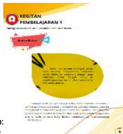
Gambar 8. Halaman Pembelajaran 1 Modul

Berikut ini halaman Pembelajaran yang berisi Kompetensi Dasar (KD) kegiatan pembelajaran 1 yang membahas unsur intrinsik/struktural dari karya sastra dan dalam novel harga sebuah percaya karya Tere Liye.