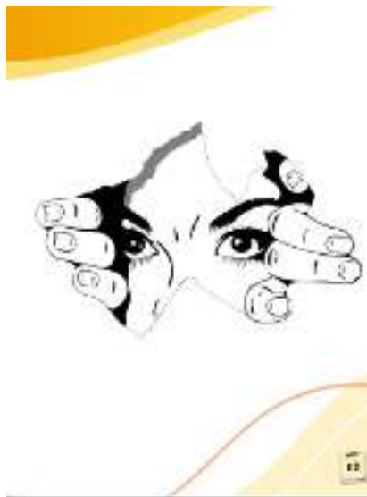
Gambar 12. Animasi dalam Modul