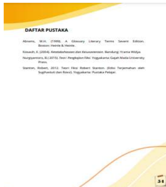
Gambar 11. Halaman Daftar Pustaka Modul

Selain itu, modul ini juga dilengkapi dengan fitur gambar-gambar animasi yang dapat membuat siswa senang dalam belajar dan tidak monoton, kemudian modul ini juga dilengkapi dengan rangkuman dari keseluruhan materi.