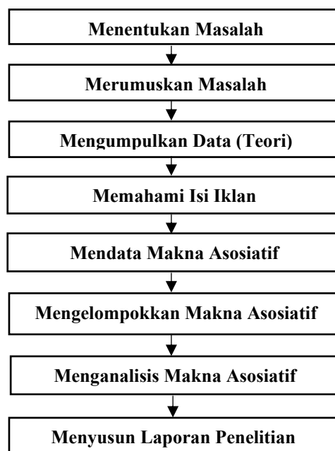
Bagan 3.1 Desain penelitian

Desain penelitian adalah gambaran atau rancangan untuk melaksanakan penelitian. Dalam penelitian ini pendekatan yang digunakan adalah pendekatan kualitatif. Sebagaimana yang dikemukakan Nugrahani (2014, hlm. 4) Penelitian kualitatif merupakan penelitian yang dapat memperoleh hasil berupa pemahaman tentang kenyataan melalui proses berpikir induktif dan tidak bisa ditemukan lewat metode kuantitatif. Sedangkan metode yang digunakan dalam penelitian ini adalah metode deskripsi yang bertujuan untuk mendeskripsikan makna asosiatif yang terdapat pada iklan layanan masyarakat Korea tentang kampanye pencegahan COVID-19. Adapun desain atau rancangan pemikirannya adalah sebagai berikut: