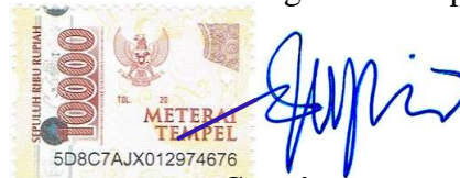
Supriyanto NIM. 1602733

Bandung, 31 Januari 2022 Yang membuat pernyataan,