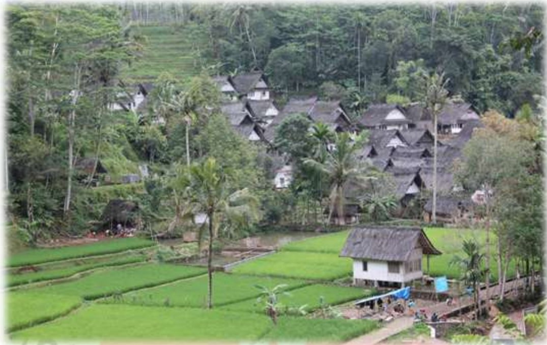
Gambar 3.1 Lokasi Kampung Naga