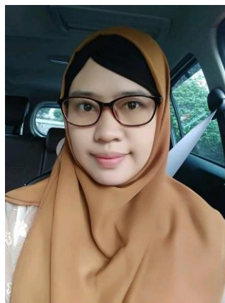
Gambar 3. 2 Pangarang Novelét Jamparing