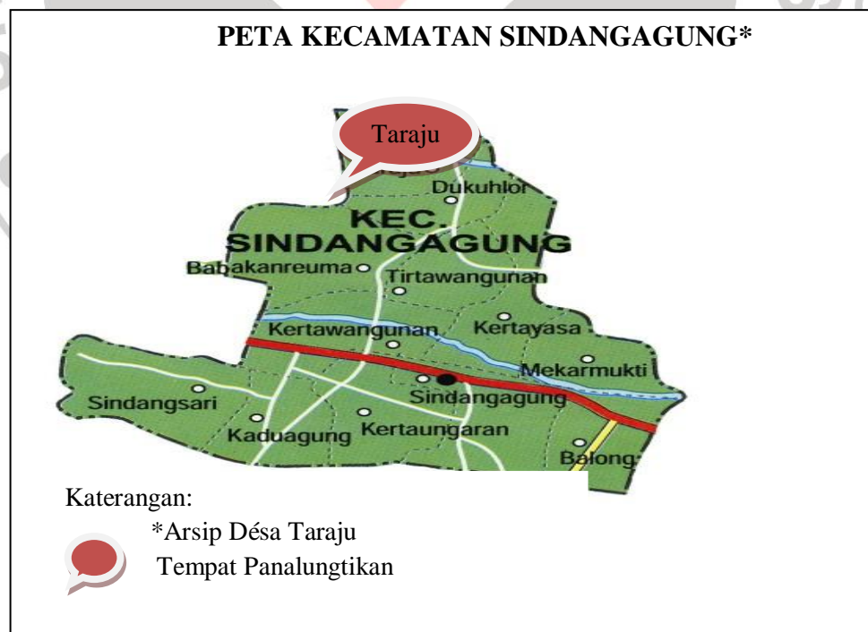
Gambar 3.1 Peta Tempat Panalungtikan