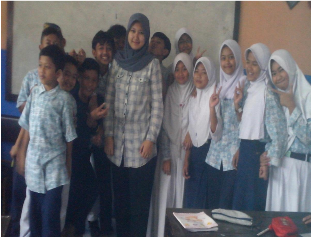
Intan jeung Sawatara Siswa Kelas VII A