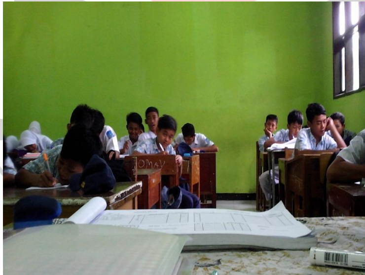
Pretest di Kelas Kontrol (VII D)