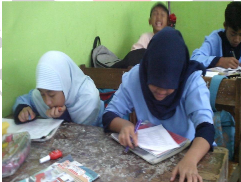
Siswa Ngeusian Angkét di Kelas Kontrol (VII D)