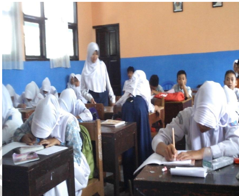
Pretest di Kelas Éksperimén (VII A)