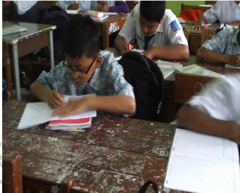
Posttest di Kelas Kontrol (VII D)