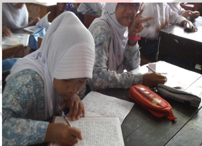
Posttest di Kelas Éksperimén (VII A)