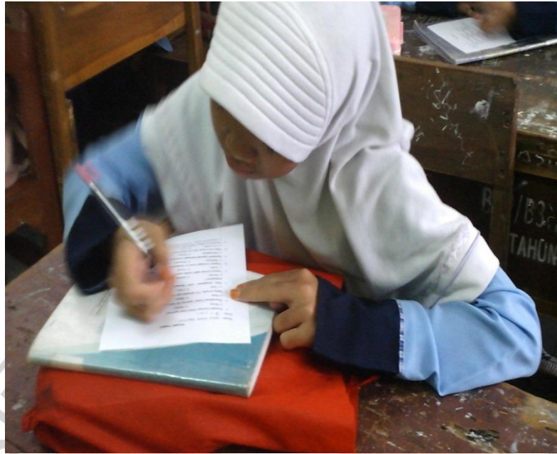
Siswa Ngeusian Angkét di Kelas Ékspérimén (VII A)