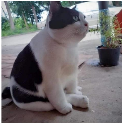
Gambar 3. 2 Kucing

Sumber data yang digunakan pada penelitian ini berupa gambar dari salah satu postingan di media sosial Instagram. Instagram sendiri merupakan salah satu media sosial yang sering kali digunakan untuk mengunggah foto, gambar, atau video. Menurut Iman (2020) di Indonesia pengguna aktif media sosial ini menyentuh di angka 69,2 juta (enam puluh sembilan juta dua ratus tujuh puluh ribu) pada periode Januari-Mei 2020 yang terus mengalami peningkatan dari bulan ke bulan untuk pengguna platform berbagi foto ini. Gambar yang menjadi sumber data dari penelitian ini berupa gambar kucing yang diunggah oleh akun Meme Comic Indonesia di Instagram.