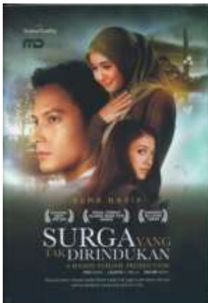
Gambar 3.18 Jilid novel Surga yang Tak Dirindukan