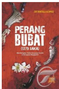
Gambar 3.2 Jilid Buku Perang Bubat