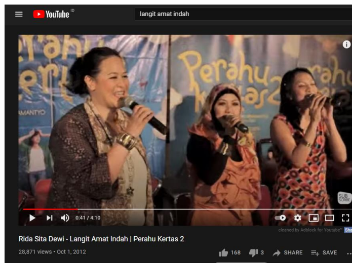
Gambar 3. 1RSD-Langit Amat Indah