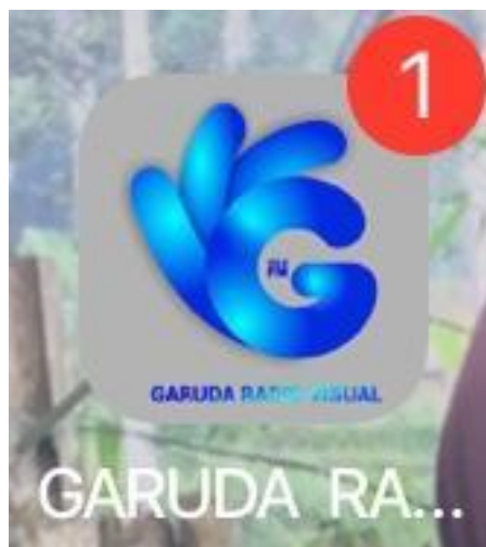
Gambar 3.2 Aplikasi Garuda Radio Visual