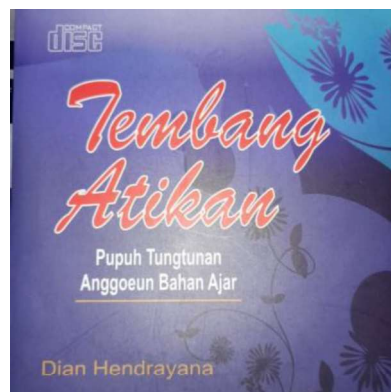
Gambar 3.1 Album Tembang Atikan