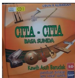
Gambar 3.2 Album CD Kawih Asuh Barudak Cita-Cita