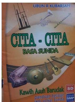
Gambar 3.1 Buku Rumpaka Album Kawih Asuh Barudak Cita-Cita