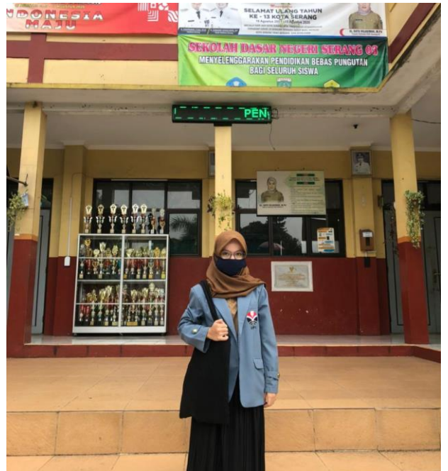
Lokasi penelitian SDN Serang 03