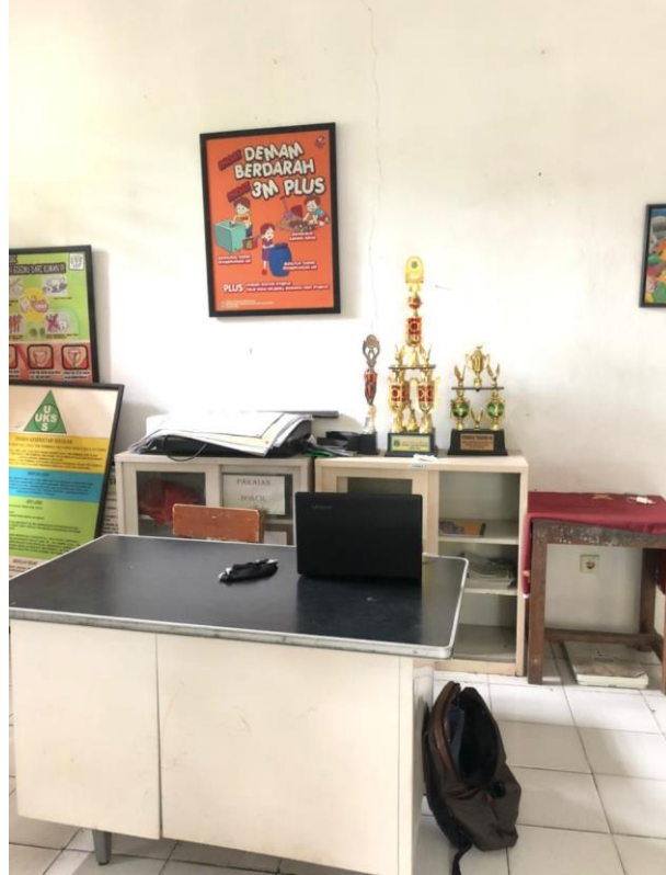
Ruangan UKS yang biasanya digunakan untuk melakukan layanan BK (sebelum pembelajaran daring)