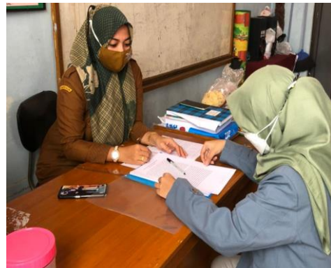
Peneliti bersama wali kelas II yang sedang melakukan wawancara secara langsung