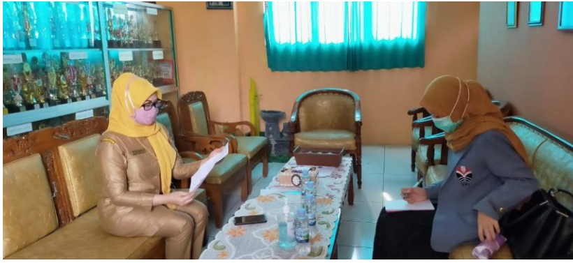
Saat peneliti melakukan wawancara dengan kepala sekolah SDN Serang 03