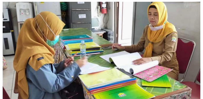
Peneliti bersama wali kelas V yang sedang melakukan wawancara secara langsung di lokasi penelitian