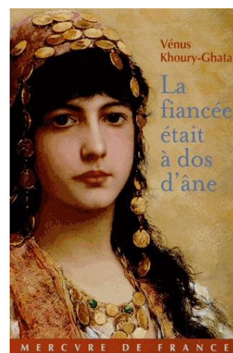
Image 1. Le roman de La Fiancée Était À Dos d'Âne