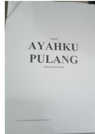
Gambar 3.2 Jilid Naskah Drama “Ayahku Pulang”

(sinopsis tina naskah drama “Ayahku Pulang”)