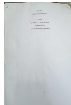
Gambar 3.1 Jilid Naskah Drama “Nu Jaradi Korban”