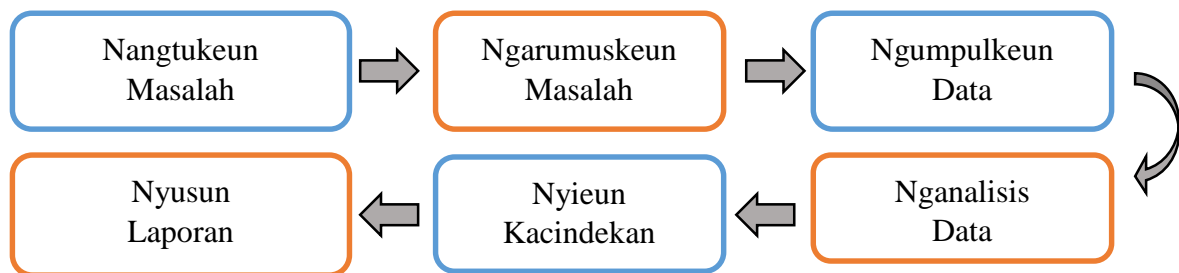
Bagan 3.1 Désain Panalungtikan