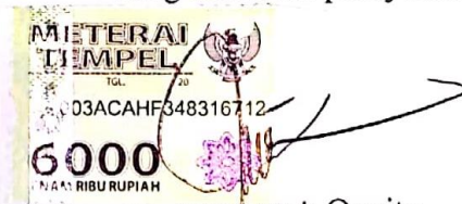
Amatulloh Qonita NIM 1403913

Bandung, Agustus 2020 Yang membuat pernyataan,