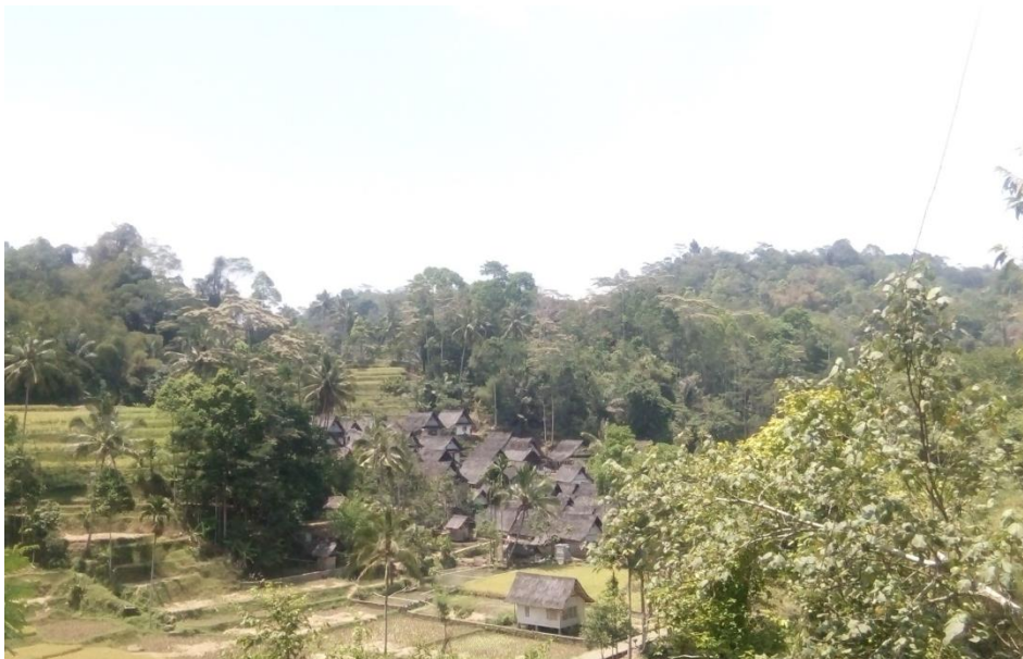
Gambar 3. 1 Lokasi Panalungtikan

Lokasi ieu panalungtikan nyaéta di Kampung Naga. Kampung Naga ayana di kéncaun jalan ti Garut ka Tasikmalaya. Ieu Kampung Naga lokasina ti Kota Kabupaten Tasikmalaya ka beulah kulon kurang leuwih 30 km, sedengkeun saupama ti Kota Garut ka beulah wétan kurang leuwih 26 km.