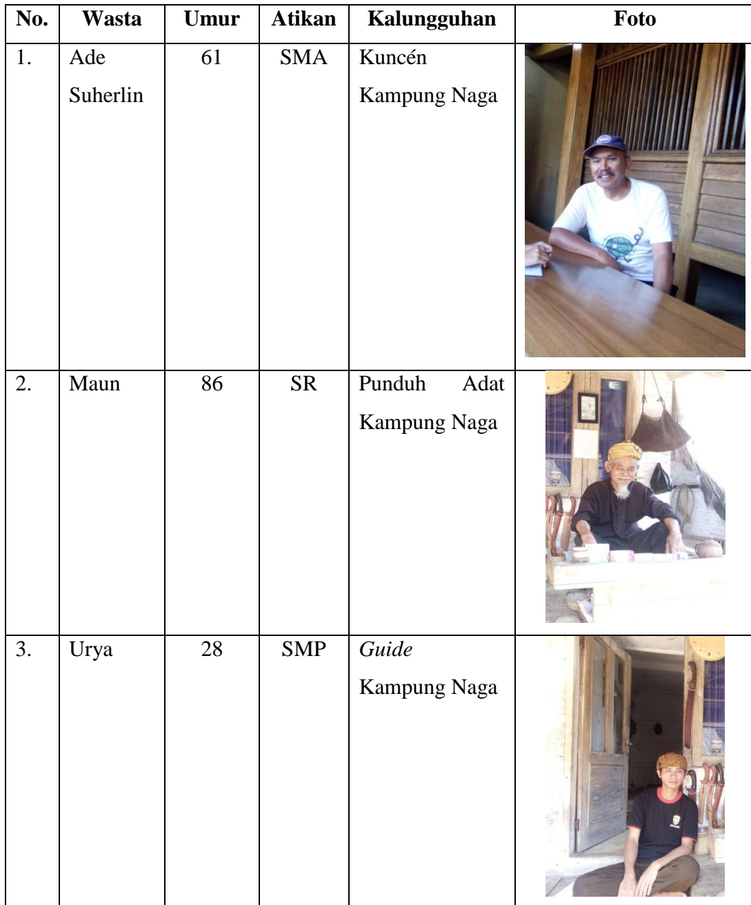
Tabél 3. 2 Sumber Data Panalungtikan

sesepeuh anu aya di kampung Naga anu maham kana tradisi di Kampung Naga. Kitu ogé warga masarakat kampung Naga anu maham kana tradisi anu aya di Kampung Naga.