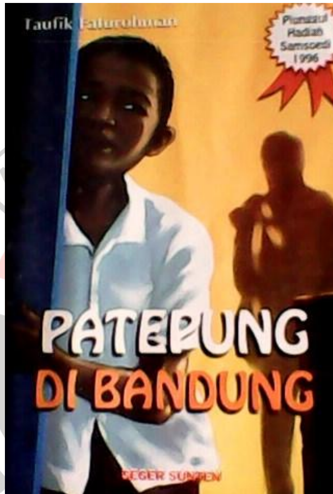
Gambar 3.1 Cover Novél Patepung di Bandung

Novél Patepung di Bandung mangrupa hasil karancagéan salasahiji pangarang Sunda nya éta Taufik Faturohman. Ieu novél téh munggaran medal bulan Désémber taun 1995 anu diterbitkeun ku CV Geger Sunten. Tuluy ngalaman citakan ulang nepi ka dua kali, nya éta citakan nu kadua bulan Oktober taun 2007 jeung citakan katilu bulan Fébruari taun 2012, nu masih dipedalkeun ku pamedal nu sarua, nya éta CV Geger Sunten nu perenahna di Bandung.