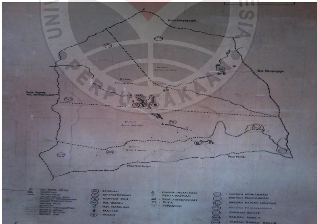
Gambar 3.1 Péta Wilayah PÉTA WILAYAH DÉSA PANYINDANGAN

Désa Panyindangan mangrupa salasahiji Désa di Kacamatan Pakénjéng Kabupatén Garut nu lega wilayahna 716 Ha. Kaayaan penduduk dina taun 2012 jumlahna aya 5.978 jiwa, nu jumlah lalakina 3.158 jeung jumlah awéwéna 2.820 jiwa. Wates Désa Panyindangan nya éta: di beulah kalér diwatesan ku Désa Linggarjati, beulah wétan diwatesan ku Désa Wangunjaya, di beulah kidul diwatesan ku Désa Bojong, di beulah kulon diwatesan ku Désa Wangunjaya. Ditempo tina topografi jeung kontur taneuh, Désa Panyindangan mangrupa dataran nu luhur antara 600–800 di luhureun permukaan laut, kaayaan suhu 30°C jeung curah hujan kira-kira 13.000 mm/taun. Sacara umum jenis taneuh nu aya di Désa Panyindangan mangrupa jenis regosol , latosol , jeung alluvial . (Sumber: Sekertaris Désa Panyindangan ).