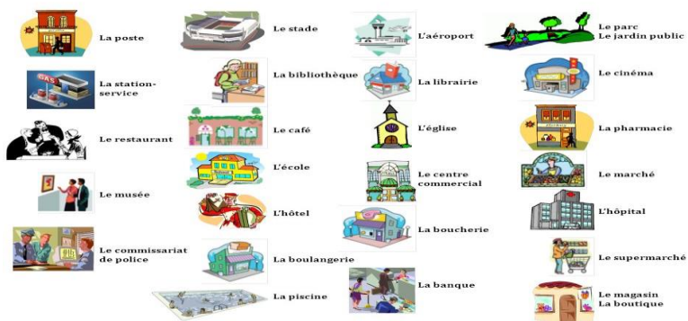
Gambar 1.3 Google Image

Penggunaan media peta kota akan membantu siswa dalam mengenal bangunan publik bukan hanya sekedar tulisan tapi berupa gambar ilustrasi jelas bangunan, posisinya dan letak bangunan yang menyerupai dengan keadaan sebuah kota sebenarnya. Sehingga memudahkan siswa untuk mengingat bangunan publik bukan hanya mendengar secara lisan tapi juga dapat melihat melalui media peta kota.