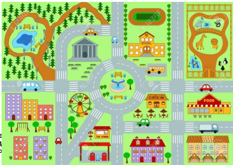
Gambar 1.1 Google Image

Media peta kota merupakan media berbasis gambar yang menggambarkan keadaan atau lingkungan sebuah kota yang didalamnya terdapat petunjuk lokasi simbol bangunan tata letak kotak yang disusun menyerupai keadaan kota sebenarnya.