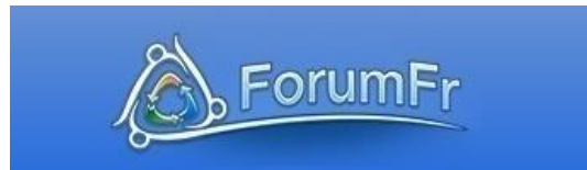
Gambar 3.2.1 Logo ForumFr

Moleong (2010) mendeskripsikan subjek penelitian sebagai informan, yang artinya orang pada latar penelitian yang dimanfaatkan untuk memberikan informasi tentang situasi dan kondisi latar penelitian. Dalam penelitian ini, subjek yang akan diteliti adalah kumpulan percakapan yang mengandung prinsip kerjasama dan prinsip kesopanan pada forum daring. Menurut Sulistyarni (2011) forum daring adalah sebuah sarana komunitas di internet yang biasanya di bentuk dengan merekrut pengguna untuk membahas topik-topik yang di sukai masing-masing pengguna pada bagian pembahasan di forum tersebut. Dalam penelitian ini, forum daring yang akan digunakan adalah forum daring yang berasal dari Perancis yaitu ForumFr ( www.forumfr.com ).