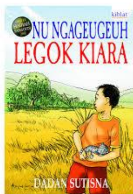
Gambar 3.1 Cover Buku Novel