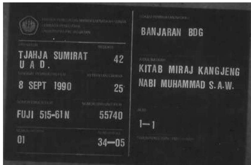
Gambar 3.1 Keterangan Mikrofilm