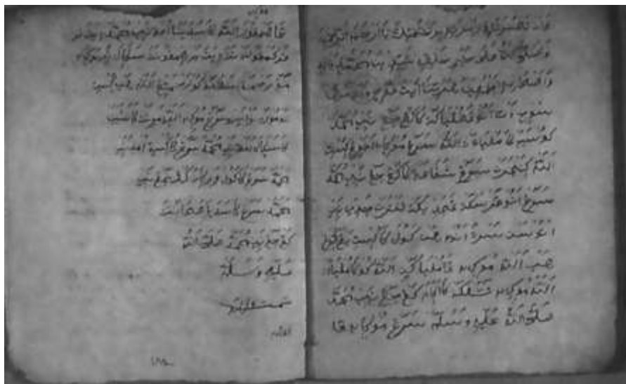
Gambar 3.4 Kaca Pamungkas