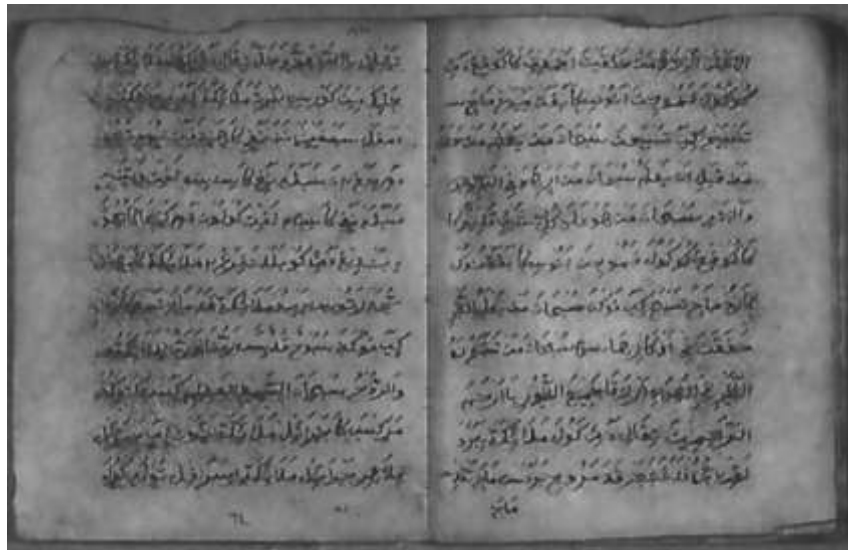
Gambar 3.3 Kaca Tengah (93-94)