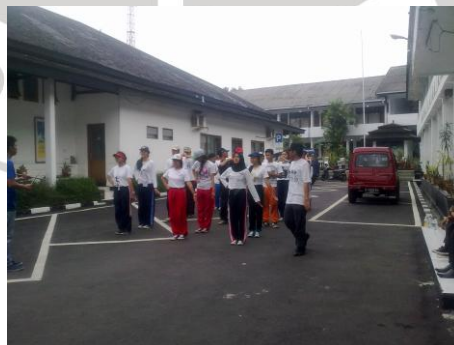
Gambar 3.2 Tempat Latihan Marching Band

Latihan dilaksanakan di area parkir dan halaman gedung kantor Pemerintah Daerah Kota Sukabumi.