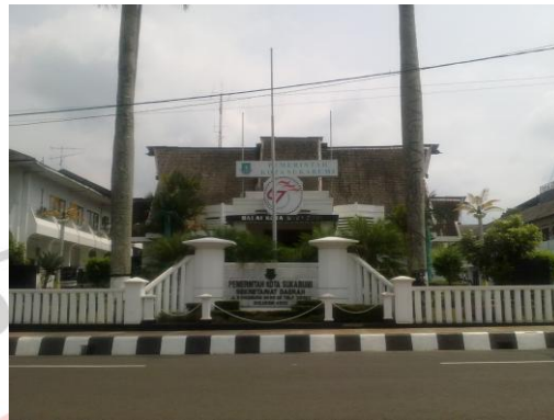
Gambar 3.1 Gedung Kantor Pemerintah daerah Kota Sukabumi

Kantor Pemerintah daerah Kota Sukabumi di jalan R.Syamsudin,SH. No. 25 merupakan tempat latihan Marching Band Gema Suara Korpri Kota Sukabumi. Selain itu, Kantor Pemerintah daerah Kota Sukabumi letaknya cukup strategis sehingga mudah di jangkau untuk melakukan penelitian.